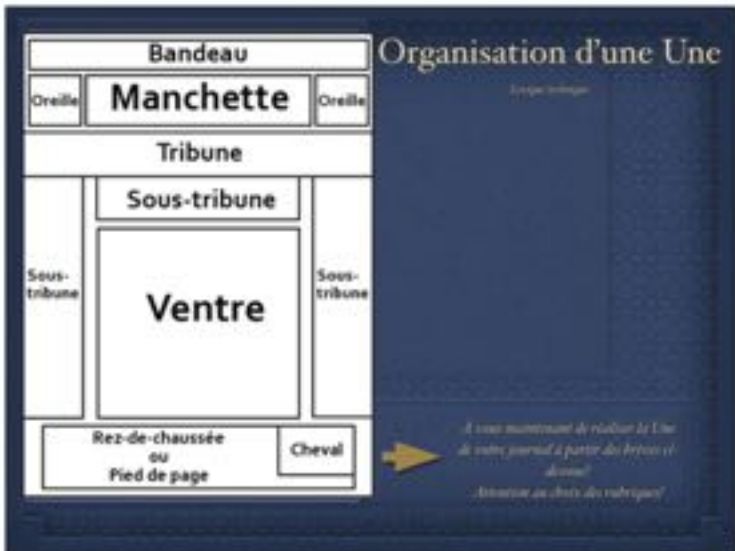
Dénomination des zones composant la une d'un journal - https://fr.wikipedia.org/wiki/Une_(journalisme)