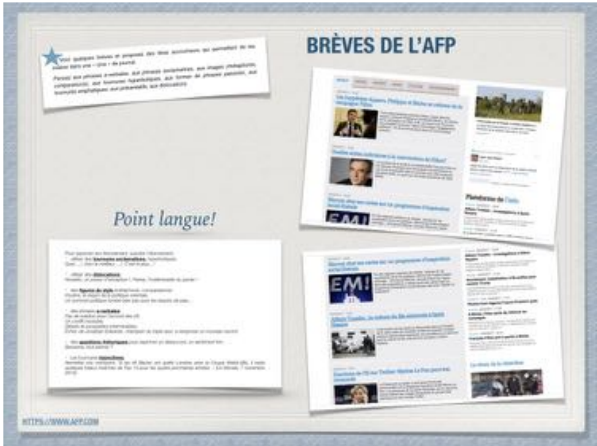
Dépêches de l'AFP, 2 mars 2017 - https://www.afp.com