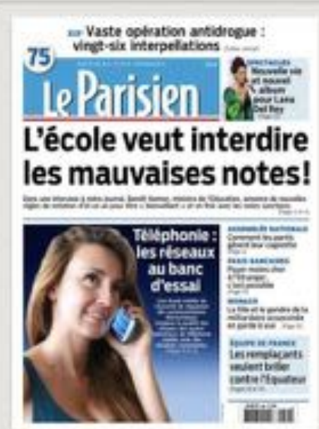
Le Parisien, 24 juin 2014