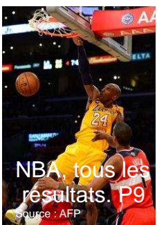
NBA, tous les résultats. P9

Le juge Gentil manquerait-il d'impartialité ? En tout cas, il en est accusé... lire p 2 et 3