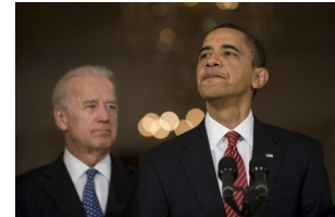
Discours de B. Obama et Joe Biden

L'Assurance maladie n'existait pas aux Etats-Unis. 36 millions d'américains n'étaient pas assurés. Pour cela, Obama a décidé de créer une réforme « historique » de l'assurance maladie. Le 21 mars, il gagnait une victoire en permettant à 95% des Américains de moins de 65 ans d'obtenir une couverture santé. Mais pour beaucoup, cette réforme ne fera juste qu'augmenter les dettes de l'Amérique. P.5