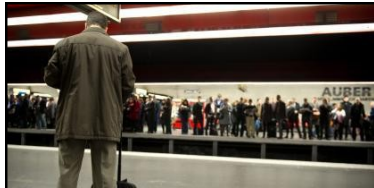
Station de métro Auber, un jour de grève