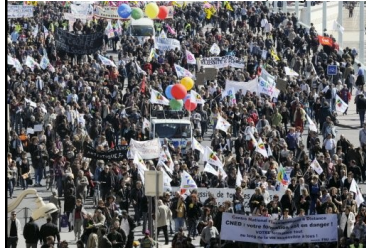
Manifestation à Marseille