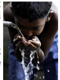
Garçon dans un bidonville du Sri Lanka

Ça coule de source, le réchauffement climatique y est aussi pour quelque chose. Le monde se déshydrate ! P.8